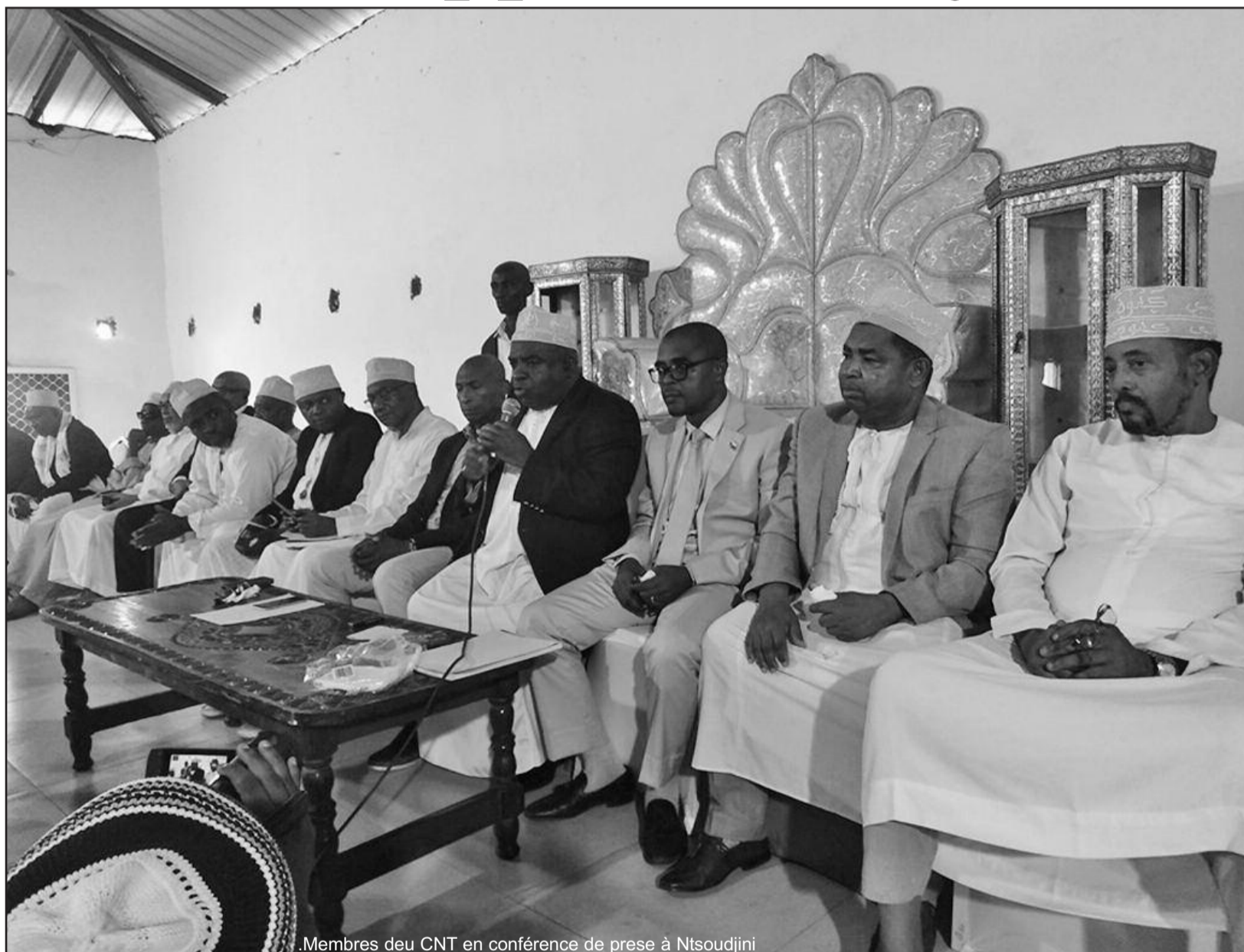
Membres du CNT en conférence de presse à Ntsoudjini

Le Conseil National de Transition demande que le 26 mai prochain soit une journée nationale « île morte ». L'annonce est faite hier à Ntsoudjini, au cours d'une conférence de presse transformée par la suite en meeting par les discours et les applaudissements de la foule venue en masse.