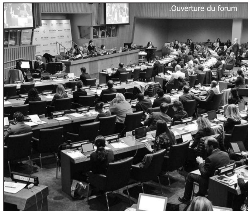
Ouverture du forum

Sous le thème transversal d'inclusion et d'égalité, s'est tenu du 14 au 15 mai 2019 au siège des Nations Unies à New York, le 4e Forum annuel multipartite sur la science, la technologie et l'innovation (STI) pour les objectifs 4, 8, 10, 13 et 16 de développement durable (ODD).